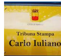
FOTO SHOW - STADIO MARADONA, RESTAURATA NELLA TRIBUNA STAMPA LA TARGA INTITOLATA A CARLO IULIANO

NAPOLI - Restaurata nella Tribuna Stampa Carlo Iuliano dello Stadio Maradona la targa intitolata al grande maestro di giornalismo... Continua a leggere >>